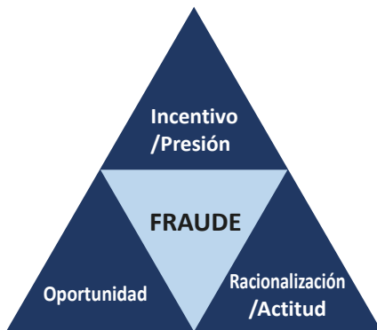
Gráfico No. 2 Triángulo de fraude

Los factores de riesgo no necesariamente señalan la existencia de fraude, sin embargo, a menudo están presentes en las circunstancias cuando se presenta, contribuyendo así a identificar riesgos potenciales. Las combinaciones de estos tres factores conforman el triángulo de fraude, materializándolo.