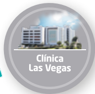
Clínica Las Vegas