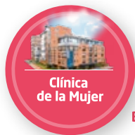
Clínica de la Mujer