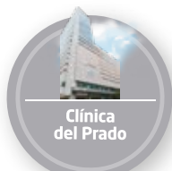
Clínica del Prado